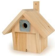
Niohir « Montagnard » LPO

Il faudrait également mettre 4 niohirs avec trou d'envol de diamètre 28 mm , adapté pour accueillir les petites mésanges (bleue, huppée, nonette) . Toutes sont des espèces protégées .