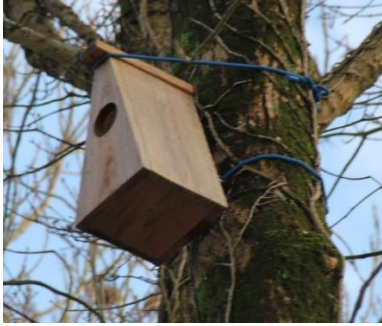
Parc du Pargo Vannes