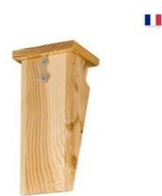
Nichoir Grimpereau LPO

Pour faciliter la reproduction du Grimpereau, il faudrait installer des nidoirs conçus pour cette espèce : un dans la partie ouest de la zone boisée et un autre dans la partie est.