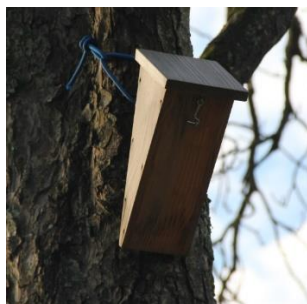
Parc du Pargo Vannes