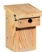
Nichoir Loggia LPO

Pour la Sittelle torchepot et la Mésange charbonnière, le trou d'envol doit avoir un diamètre de 32mm.