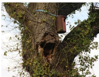
Parc du Pargo Vannes

On pourrait installer un nichoir pour la Chouette hulotte sur un Pin de cette partie du bois du Grézit.