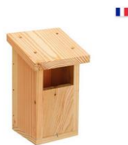
Nichoir Rougegorge LPO