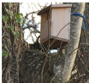
Parc du Pargo Vannes

On pourrait également disposer 5 nichoirs pour oiseaux semi-cavernicoles comme le Rougegorge familier (espèce protégée) sur l'ensemble de l'espace vert.