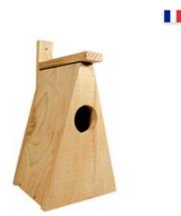
Nichoir huppe fasciée LPO

La part la plus importante de la population bretonne de Huppe fasciée est concentrée sur l'est du Morbihan et le sud de l'Ille-et-Vilaine. Arradon est près des limites nord et ouest de l'aire de répartition. Les effectifs de cette espèce restent fragiles. Sa présence au Grézit est une richesse écologique à préserver .