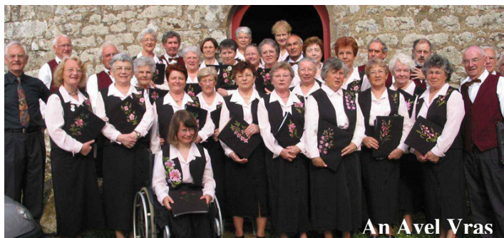
An Avel Vras