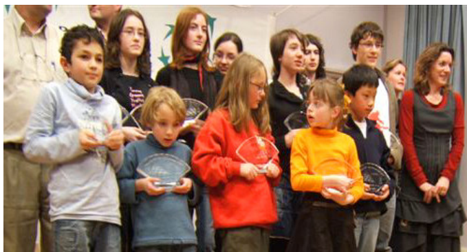
Les champions de Bretagne