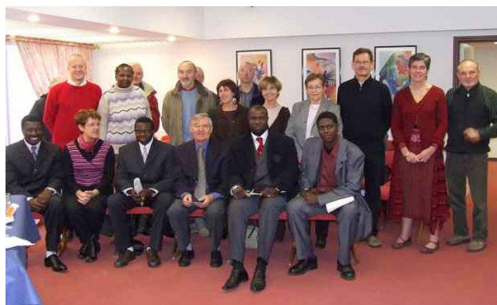
Accueil à la mairie des représentants des partenaires sénégalais à l'occasion du 30 ème anniversaire

La collecte de journaux aura lieu samedi matin 7 avril à l'endroit habituel, parking du camping municipal à Arradon. Les journaux et revues doivent être attachés par paquets. Merci pour votre compréhension et votre soutien à ces différentes actions de solidarité.