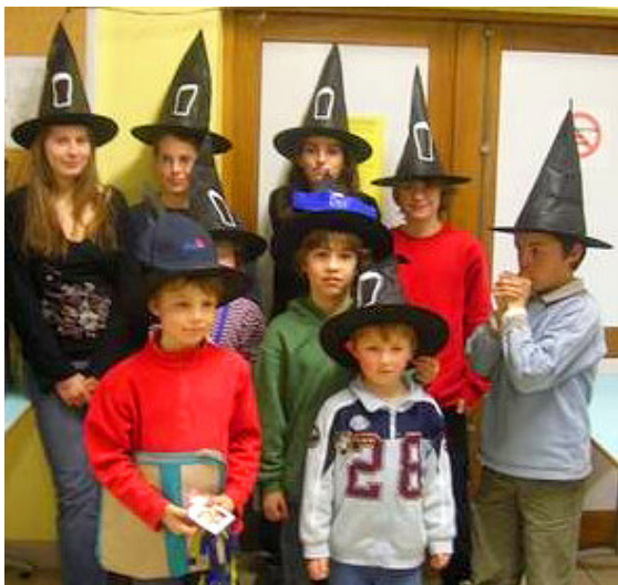
Le LUDOQUIZZ, samedi 3 février 2007

La participation au LUDOQUIZZ des juniors et des seniors a été en hausse cette année, avec un jeu interactif sur l'actualité européenne 2006. Ce jeu organisé dans le but de verser une contribution financière à la Banque alimentaire de Vannes s'est conclu par la remise de plusieurs prix : Prix de l'Europe, Prix de l'Humour et Prix de l'Excellence.