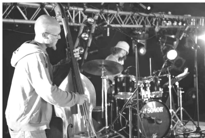
Le groupe Rivaricha